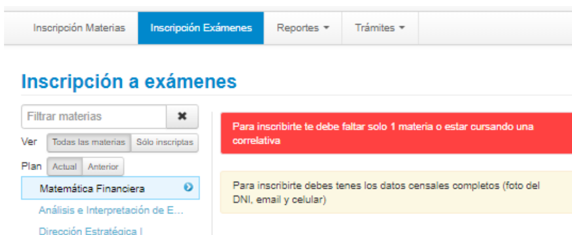
Imagen 6 - Notificación de situación

En caso que el alumno no cumpla con lo establecido en la Resolución de Decanato 050/2020 antes mencionada, el sistema emitirá un mensaje indicando los motivos de tal situación, tal como se puede observar en el caso del alumno que muestra la Imagen 6 .