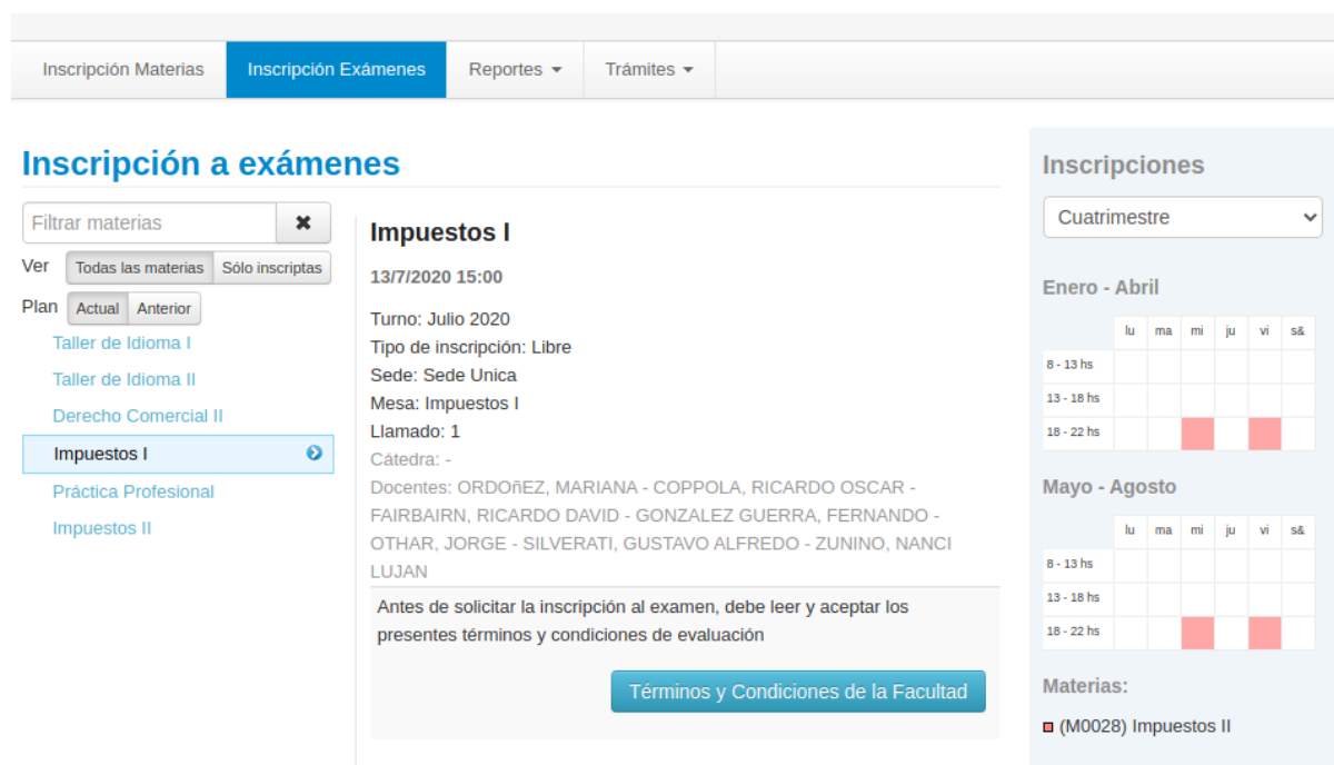
Imagen 3 - Términos y Condiciones de la Facultad

En caso que el alumno cumpla con lo establecido en la Resolución de Decanato 050/2020 antes mencionada, le permitirá inscribirse a la mesa examinadora, previa aceptación de los “Términos y Condiciones de la Facultad” que la excepcionalidad de la situación requiere, tal como se puede ver en la Imagen 3 .