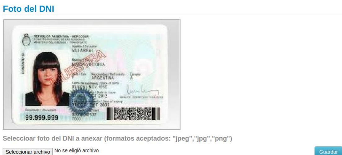
Imagen 2 - Foto del DNI cargada

Inicialmente, al no haber foto cargada, se muestra una imagen indicando dicha situación. Presionando sobre el botón “Seleccionar archivo” se permite adjuntar una imagen en el formato jpg, jpeg o png. Una vez seleccionada se debe presionar sobre el botón “Guardar” para que ésta quede adjuntada correctamente. Se visualizará de la forma indicada en la Imagen 2 . Es importante destacar que queda a consideración de el/los docente/s evaluadores, dar por válida la legibilidad y calidad de la imagen cargada, para garantizar si la imagen subida corresponde a una foto genuina del DNI de propiedad del alumno.