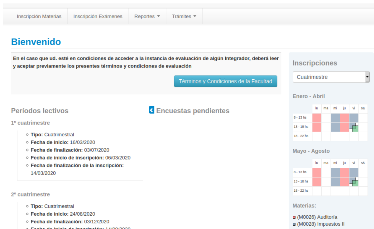
Imagen 7 - Términos y Condiciones de la Facultad

Desde el inicio de su sesión en el sistema SIU-Guaraní, tiene la posibilidad de visualizar y aceptar dichos “Términos y Condiciones” tal como se puede ver en la Imagen 7 .